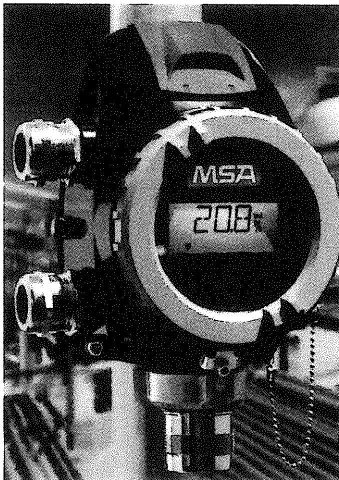
Рисунок 1 – Внешний вид газоанализаторов исполнений PrimaX I и PrimaX P